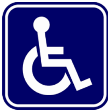
สัญลักษณ์ผู้พิการ